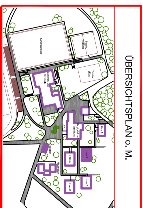
ÜBERSICHTSPLAN o. M.